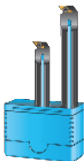
2 barres d'alésage