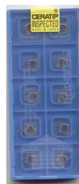
10 x plaquettes DCMT type WSP